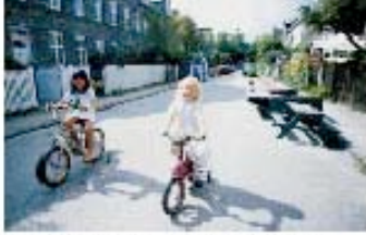
Children and picnic tables share the street.