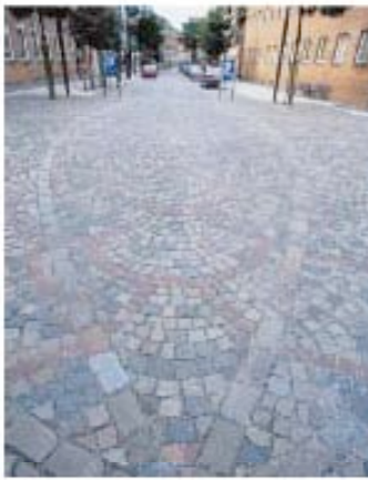
Intricate paving detailing. Note the lack of grade separation between the sidewalk and the street.