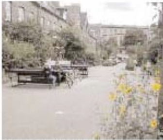
Kids, bikes, and plantings in the street