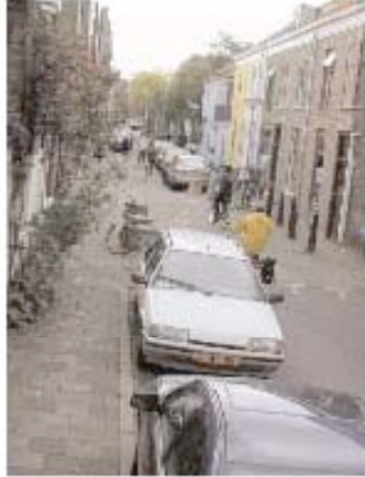
Using parking configurations to obscure sight lines. Image: Hamilton 2000