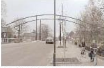
Gateway sculpture emphasizing transition to social space.