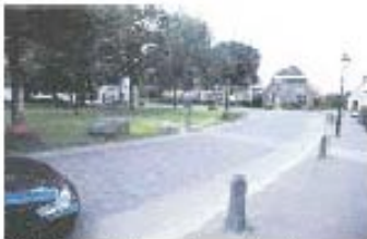
No traffic markings. Image: Hamilton 2000