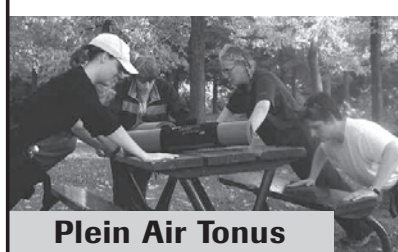
Plein Air Tonus