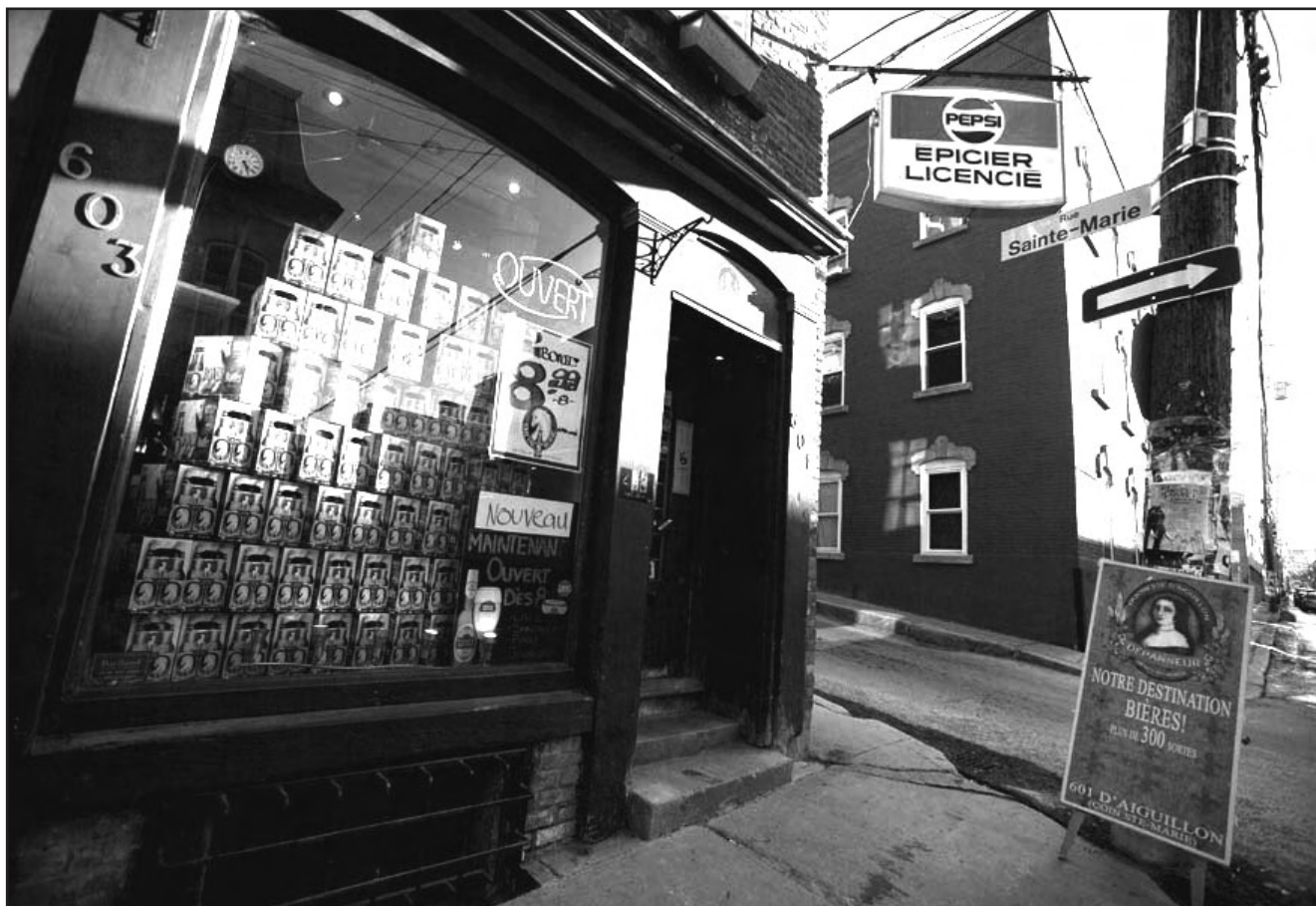
La Duchesse d'Aiguillon, coin Sainte-Marie et d'Aiguillon.

Leur idée de départ était de partir à leur compte, de développer une idée qui leur permettrait de transmettre et perpétuer leur passion : le monde des bières. Quand ils ont su que le dépanneur au coin des rues Sainte-Marie et d'Aiguillon était à vendre, tout concordait avec leur projet. Et plus encore, les cartes étaient déjà sur table: un bâtiment retapé en bonne partie, une localisation parfaite (quartier Saint-Jean Baptiste), une diversité de bières, etc. Jeff et Marc n'ont fait que prendre le risque financier en espérant être capable de relever les défis qu'ils se sont créés depuis la prise en charge de la business en février 2008.