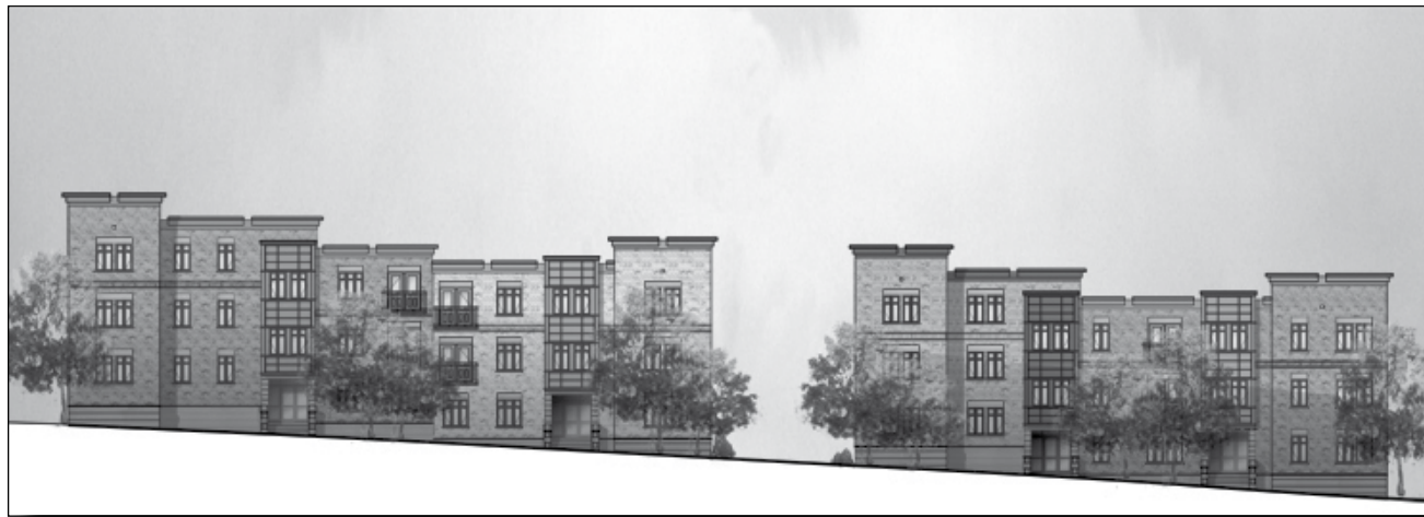
Esquisse de l'élévation sur René-Lévesque.