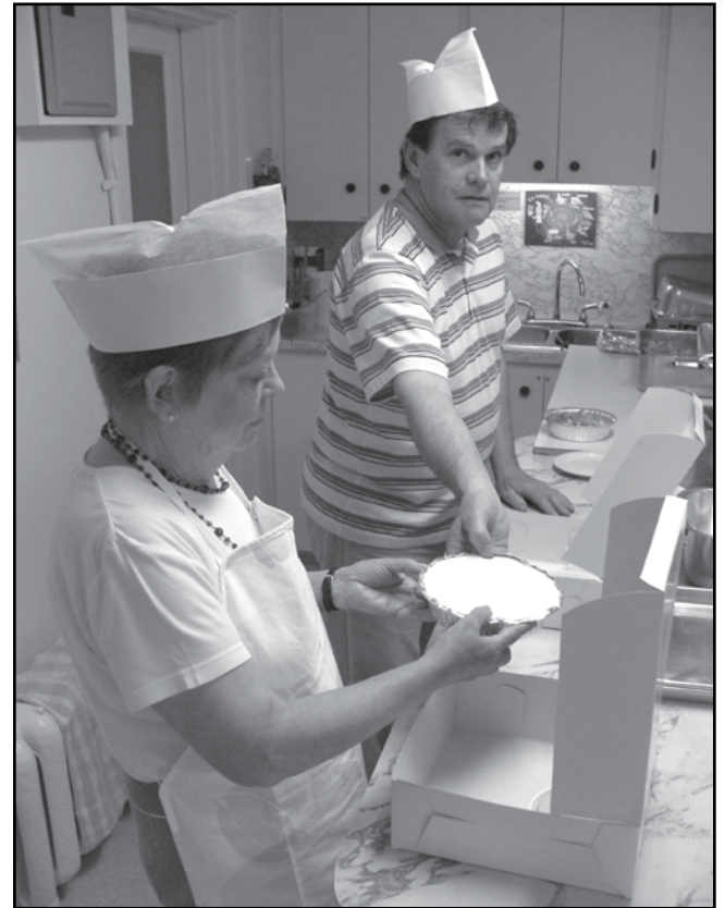
L'Entraide du Faubourg offre le lundi, le mardi et le vendredi, à un coût minime, la popote roulante pour les dîners.

Depuis ce temps, cet organisme, financé par le ministère de la Santé et des Services sociaux, diverses fondations, des caisses