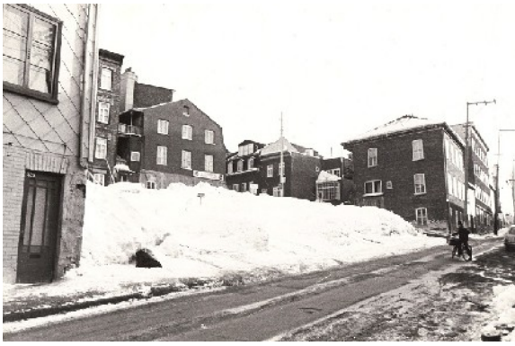
Le site du parc Scott au début des années 70