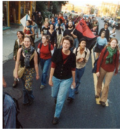
Manif du squat de la Chevrotière