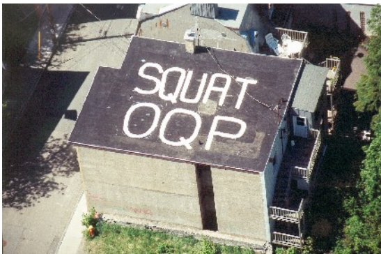
Le squat de la Chevrotière