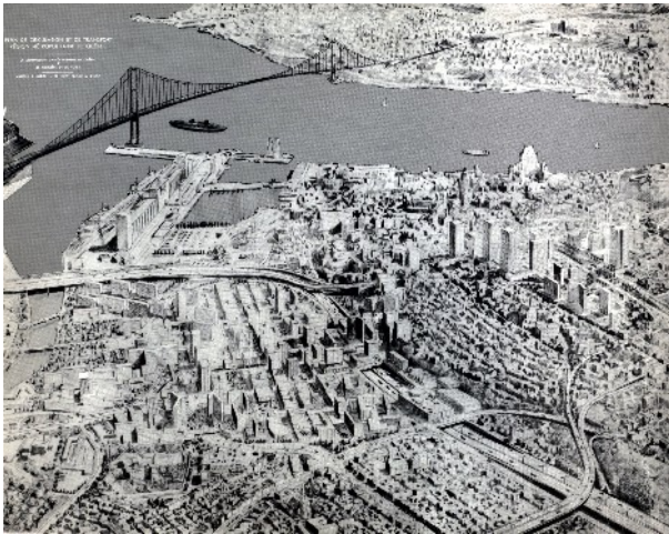
Le Québec de 1990 selon des architectes zélés