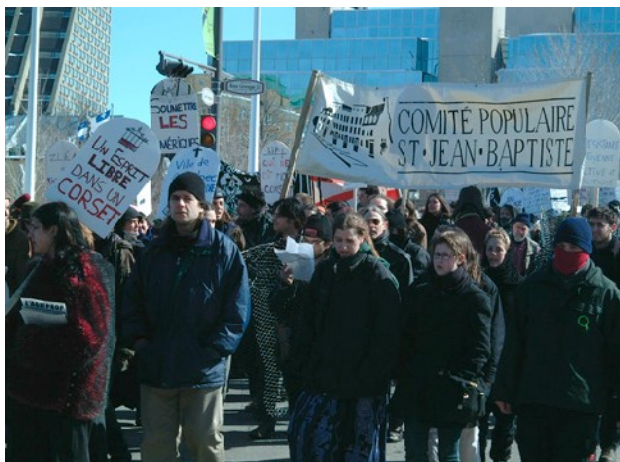
Marche funèbre du Sommet des Amériques