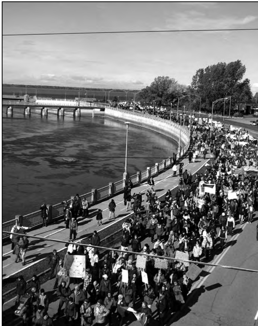
La manifestation du 17 octobre a rassemblé 10 000 personnes dans les rues de Rimouski.