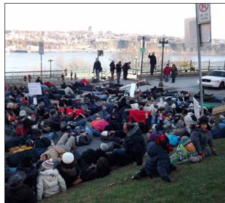
Les manifestants ont spontanément fait un die-in devant le Consulat américain de Québec.

Un autre sit-in a eu lieu sur le boulevard Dufferin sur le chemin du retour à l'Assemblée nationale. Notons que le Service de police de la Ville de Québec, qui avait été averti en bonne et due forme de la première manifestation, a brillé par son absence sur la moitié du trajet. Les manifestants ont donc dû autogérer la sécurité routière pendant une bonne partie de la marche le 18 novembre.