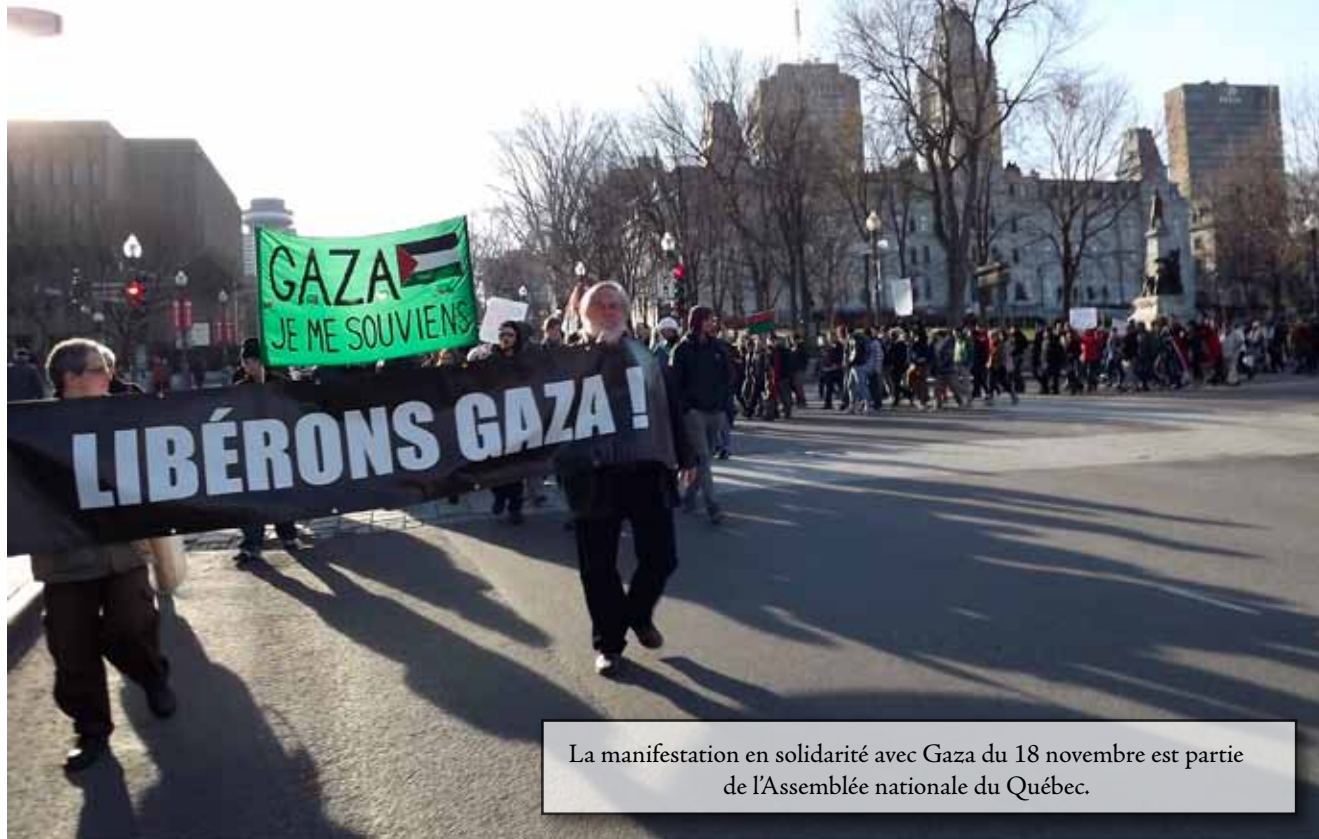
La manifestation en solidarité avec Gaza du 18 novembre est partie de l'Assemblée nationale du Québec.

Québec a connu des mobilisations pacifistes plus conséquentes par le passé, mais la plupart des gens semblaient heureux de la participation étant donné que les marches avaient été organisées dans l'urgence et sans grands moyens. À part quelques bruyants appuis, les flâneurs du Vieux-Québec semblaient plutôt