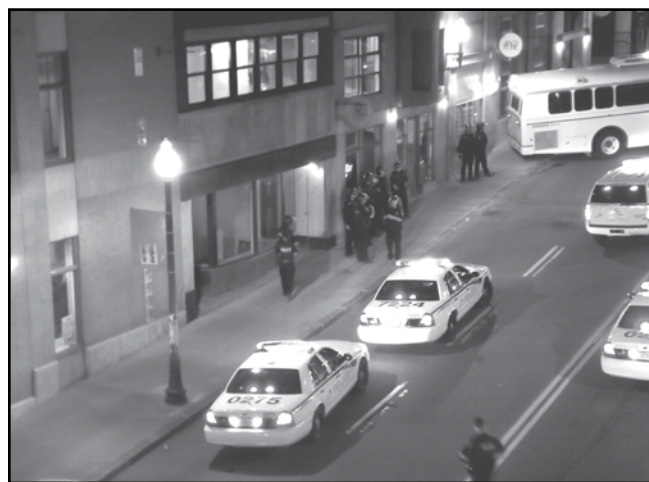
Surveillance policière sur la côte d'Abraham le 31 mai 2012.

Entre le 16 février et le 3 septembre 2012, 3 418 arrestations ont été effectuées en vertu de l'article 500.1 du Code de la sécurité routière , dont plus de 530 dans la ville de Québec. « Il est évident que l'objectif de toutes ces contraventions n'était nullement d'assurer la sécurité des automobilistes, mais bien d'intimider les manifestants et les manifestantes, de les pousser à rester à la maison », pense Karina Hasbun du Front