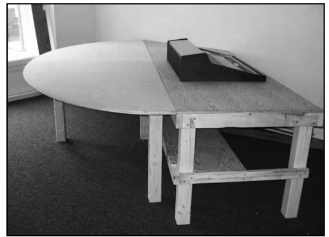
Le squelette de la toute nouvelle console de CKIA

Sans être totalement sains, les résultats financiers présentés à l'assemblée générale du 7 décembre dernier montrent au moins une diminution importante de la dette de la station. De plus, des ententes ont été prises avec presque tous les créanciers et une entente de refinancement de la dette était sur le point d'être signée. Un plan de relance, touchant à tous les aspects de la vie de CKIA, a également été déposé. On veut notamment revoir la grille de programmation pour en assurer la qualité et la cohérence