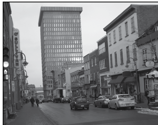
Sens des proportions : lorsque l'on parle de « monstre » et d'« erreur du passé » sur la rue Saint-Jean, c'est habituellement à ce genre de chose que l'on fait référence.

Les écarts de langage n'ont pas manqué non plus. Si les déclarations malhabiles du maire, disant que les gens qui s'opposent au projet sont des « égoïstes », ont été largement médiatisées, il est loin d'être le seul à avoir jeté de l'huile sur le feu... Il fallait voir un opposant notoire au projet abreuver d'insultes sexistes, deux fois plutôt qu'une, une salariée de GM Développement et la traiter de vendue devant tout le monde lors de la signature du registre. Un autre a carrément traité le Comité populaire d'opportuniste dans une lettre ouverte publiée sur le site du Soleil.