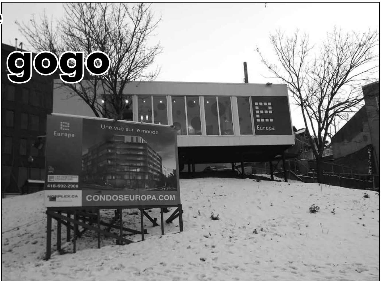
Le groupe Norplex a amorcé cet automne la vente de 82 condos de luxe sur le site de l'îlot d'Aiguillon, entre les rues d'Aiguillon, Honoré-Mercier et Richelieu.

Sur le site de l'îlot d'Aiguillon, entre les rues d'Aiguillon, Honoré-Mercier et Richelieu, le groupe Norplex a amorcé cet automne la vente de 82 condos de luxe. La publicité, racoleuse à souhait, ne fait aucune mention du quartier où habiteront les futurs acheteurs : « Le bâtiment alliant faste et modernité, érigé sur la